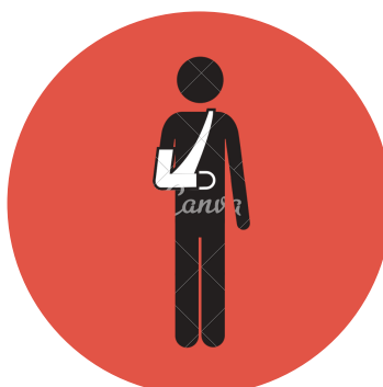
Lesioni gravi (fratture)