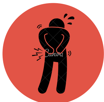
Lesioni superficiali (contusioni, distorsioni)